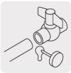
Unión con cemento