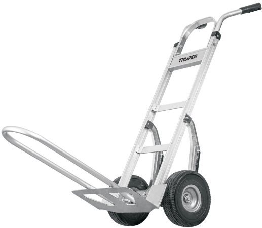
Base que brinda mayor estabilidad para cargas más grandes