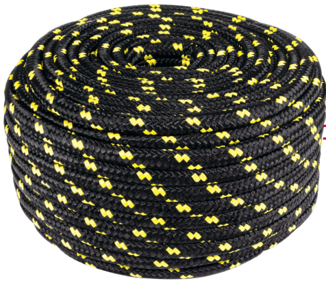
Diámetro 10 mm