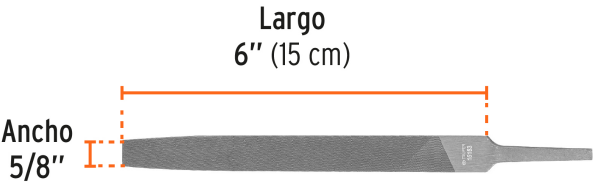
Picado doble para desbaste rápido