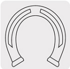
Escofina para herrar cascos de caballo