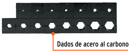
Incluye 15 juegos de dados