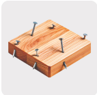
Madera con clavos