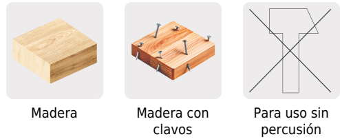
Madera Madera con clavos Para uso sin percusión