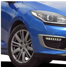
Llantas de automóviles