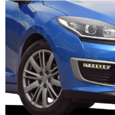
Lantas de automóviles