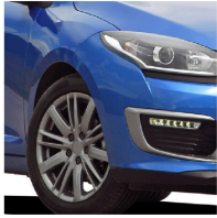
Lantas de automóviles