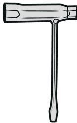
Llave para bujías