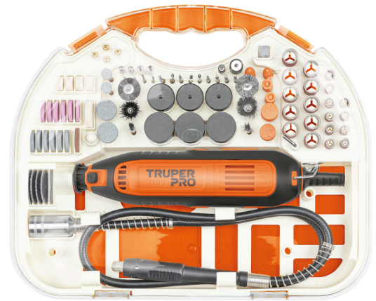
Incluye estuche organizador