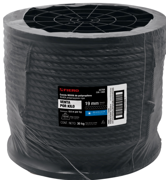
Fabricada en polipropileno