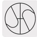
Punta Split Point