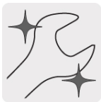
Pulido espejo para fácil limpieza