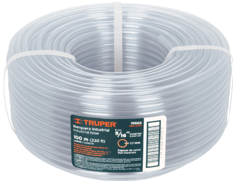
Rollo de manguera 100 m