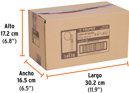
Alto 17.2 cm (6.8")