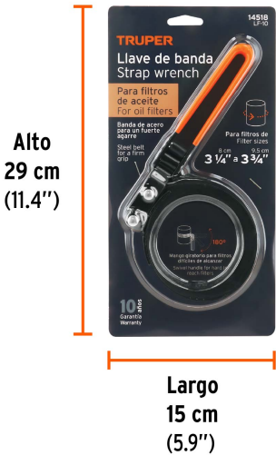
Alto 29 cm (11.4")