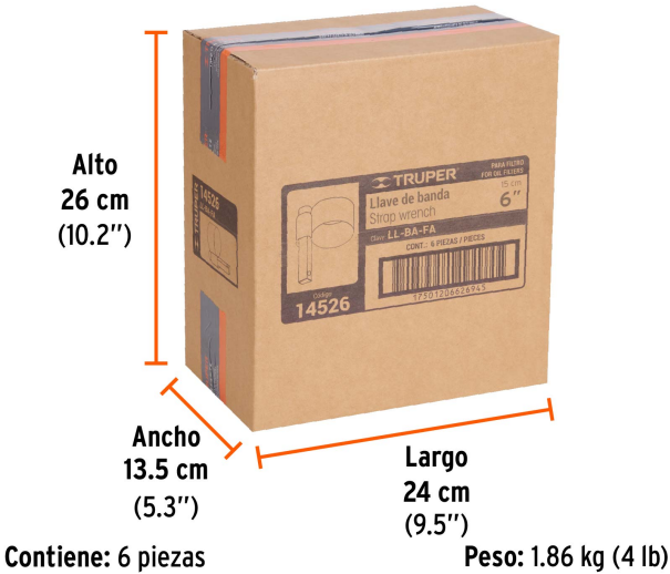
Alto 26 cm (10.2")