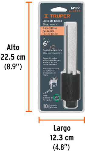
Alto 22.5 cm (8.9")