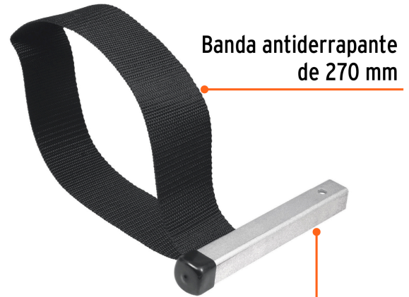
Banda antiderrapante de 270 mm