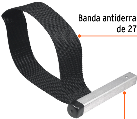
Banda antiderrapante de 270 mm