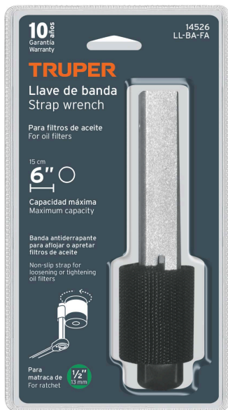
Para usarse con matraca, cuadro de 1/2"