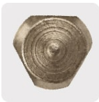
Zanco P3 antiderrapante