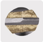
Punta de carburo de tungsteno