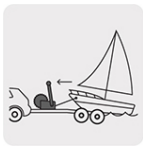
Remolque de embarcaciones