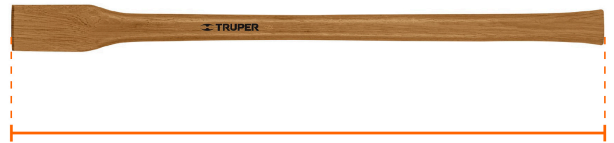
Largo 35" (88 cm)