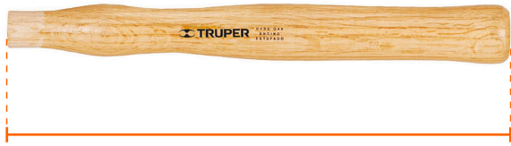
Largo 12 1/2" (31 cm)