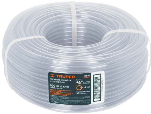
Rollo de manguera 100 m