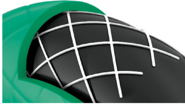
Refuerzo de tramado radial 8 hilos que evita que se doble al estirar o enrollar