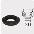
Empaque antifuga con diseño cónico