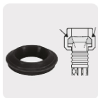
Empaque antifuga con diseño cónico