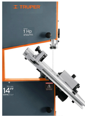
Inclinación de mesa 45°