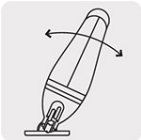
Cortes a 0°, 15°, 30° y 45° por ambos lados