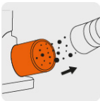
Puerto para extracción