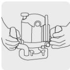
Operación a dos manos