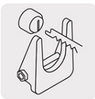
Sistema de cambio rápido