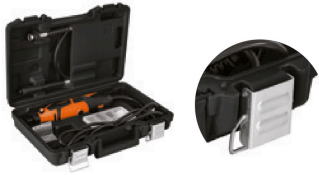
Estuche con broches metálicos