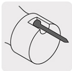
Alojamiento imantado para clavos