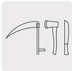
Para afilado y biselado