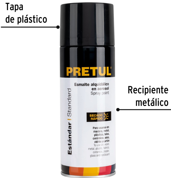
Tapa de plástico