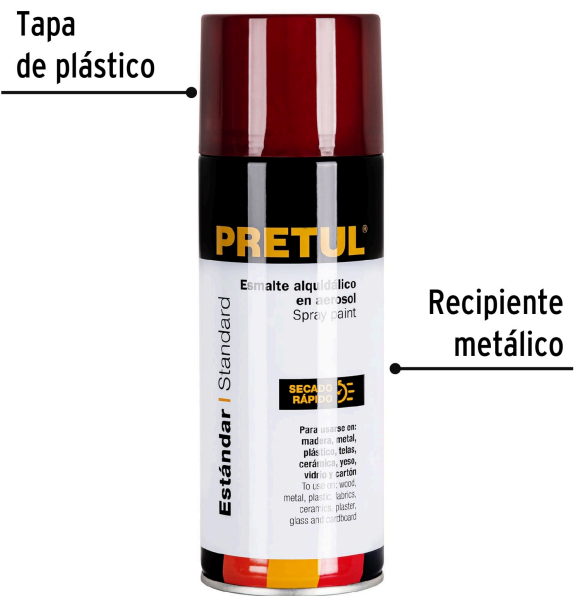
Tapa de plástico

Color aproximado. El tono puede variar de acuerdo a la superficie de aplicación