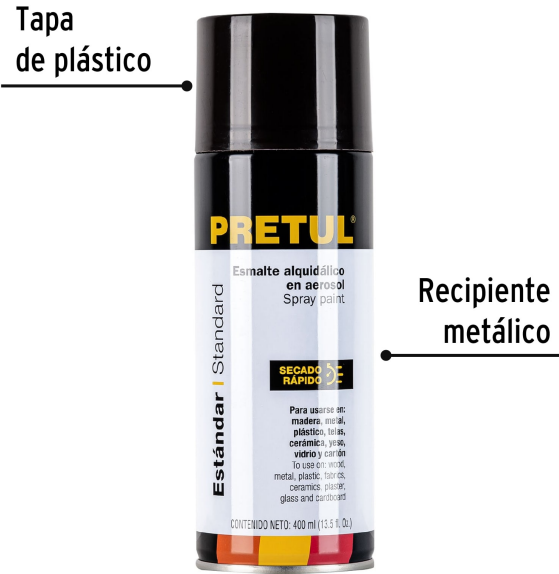
Tapa de plástico