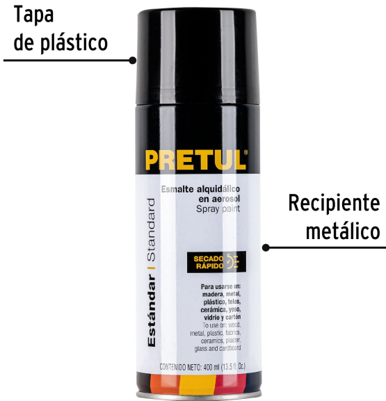
Tapa de plástico