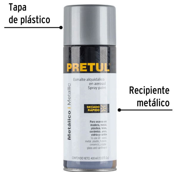
Tapa de plástico