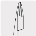
Mordazas con moleteado diagonal