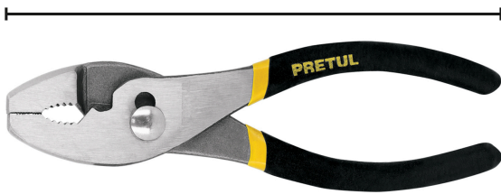
Largo 6" (15 cm)