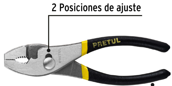
2 Posiciones de ajuste