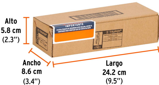
Contiene: 3 piezas