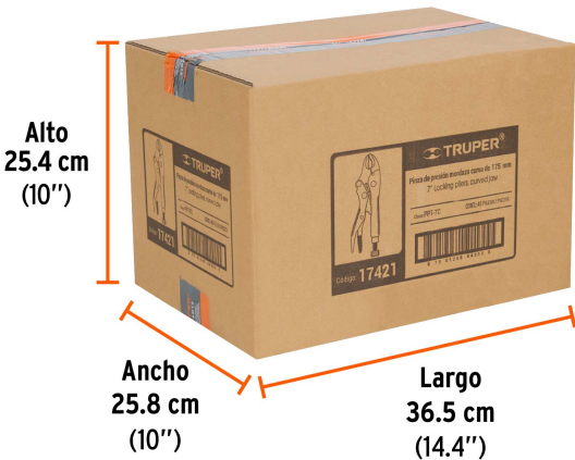
Contiene: 16 inner (48 piezas)