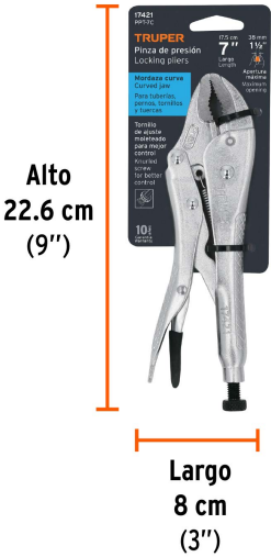
Peso: 0.33 kg (0.7 lb)