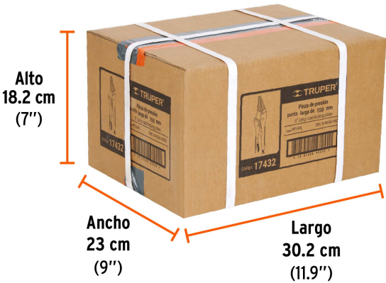
Contiene: 12 inner (36 piezas)