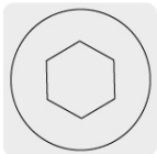
Entrada para llave allen