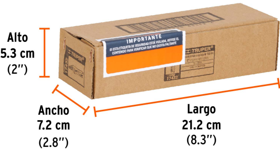
Contiene: 3 piezas