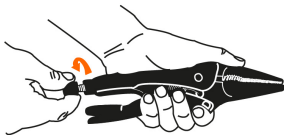
Abertura máxima de la mordaza