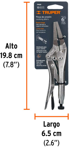
Peso: 0.18 kg (0.4 lb)