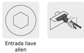
Entrada llave allen