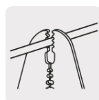
Pela cable de cobre y aluminio