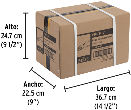
Alto: 24.7 cm (9 1/2")