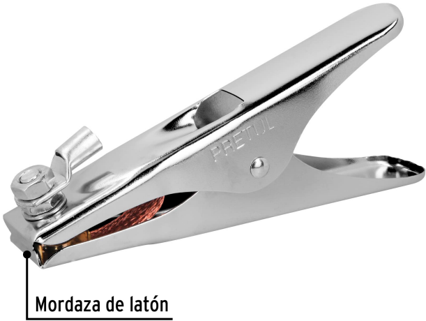
Mordaza de latón