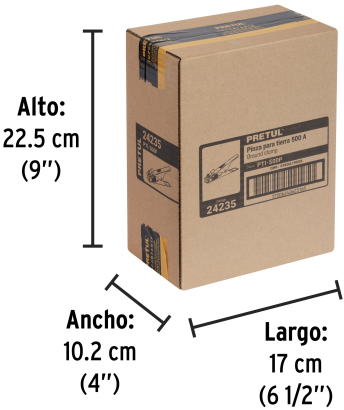
Alto: 22.5 cm (9")