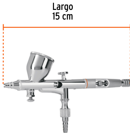
Largo 15 cm