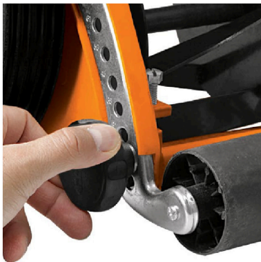
Rodillo trasero ajustable a 8 posiciones de altura de corte