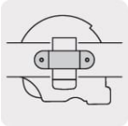
Clip de acero para flexómetro