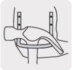
Gancho de acero para martillo