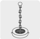
Cadena para sujetar cinta