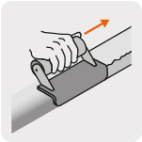
Crea borde con acabado liso